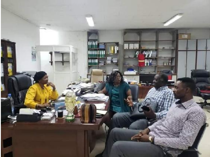
g-Phase de négociation de l'achat du bois légal auprès d'une entreprise forestière industrielle