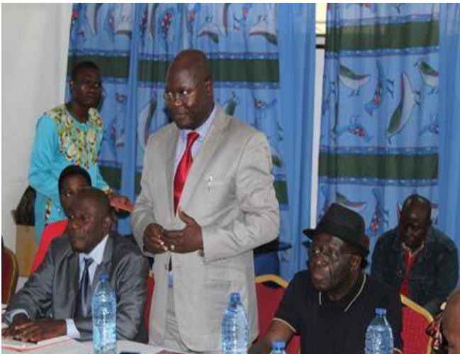
e- Mot du Représentant du MINPMEESA lors des AGO et AGE à Kribi en Août 2019