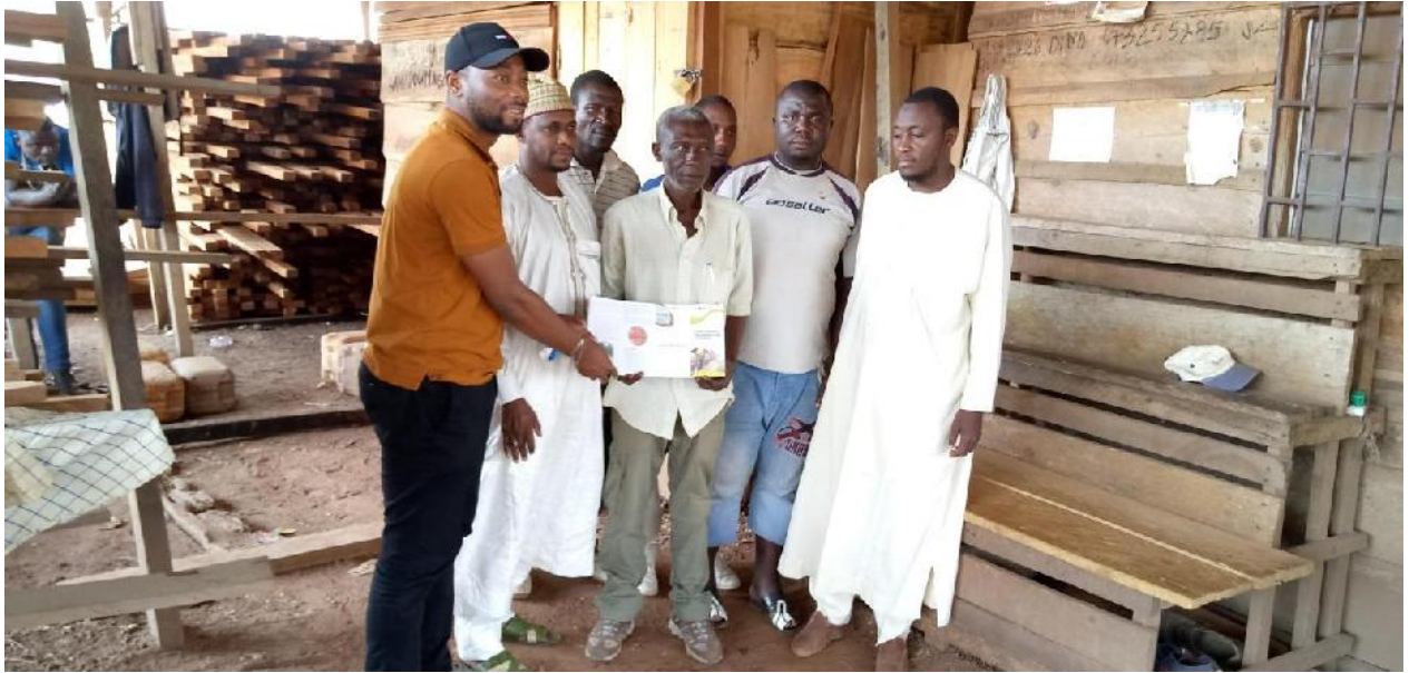
L- Remise des brochures de sensibilisation des PME/PMI et opérateurs artisanaux sur les procédures d'achat du bois légal auprès des entreprises forestières industrielles au Président de l'Association des vendeurs de bois de Bertoua, Est - Cameroun