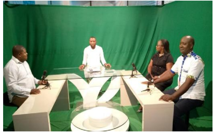
g- Débat télévisé à la CRTV sur les défis liés à l'implication de l'IFFB dans APV