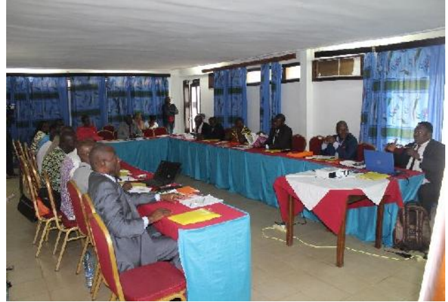
d- Vue de la salle au cours de l'Assemblée Générale Ordinaire de l'IFFB