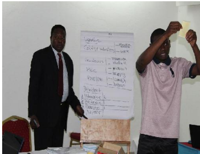
f- Dépouillement des bulletins lors du vote du Bureau Exécutif de l'IFFB