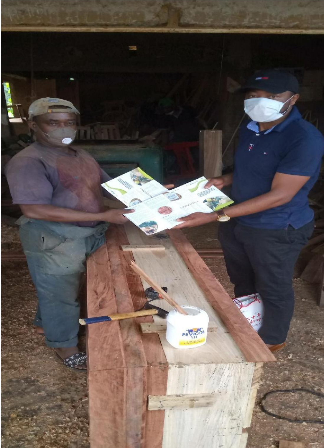
j- Remise des brochures de sensibilisation des PME/PMI et opérateurs artisanaux sur les procédures d'achat du bois légal auprès des entreprises forestières industrielles au Président de l'Association des Menuisiers d'Ebolowa , Sud - Cameroun