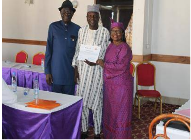
b- Remise des parchemins de formation au représentant de ARTI BOIS