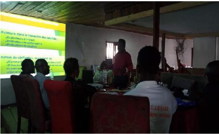
c- Formation des membres de l'association YLA en gestion des cycles de projet