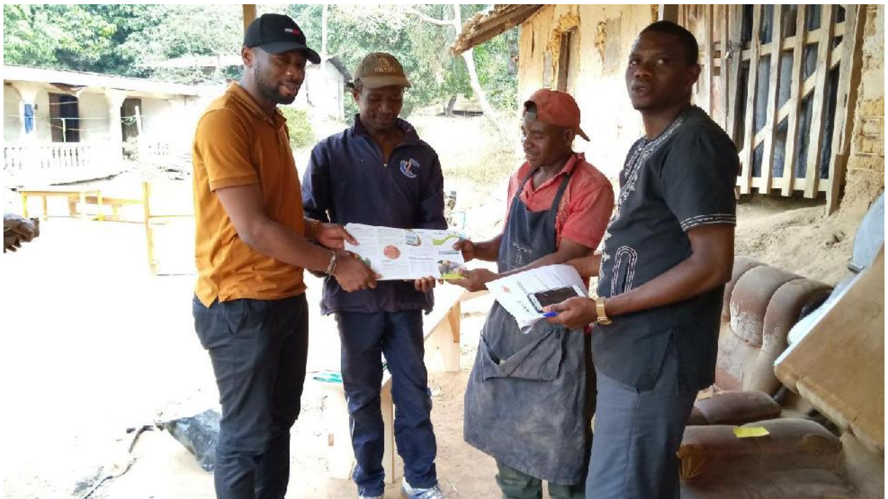
M- Remise des brochures de sensibilisation des PME/PMI et opérateurs artisanaux sur les procédures d'achat du bois légal auprès des entreprises forestières industrielles au Représentant du Président de l'Association ASTRABOIS de Bertoua, Est - Cameroun