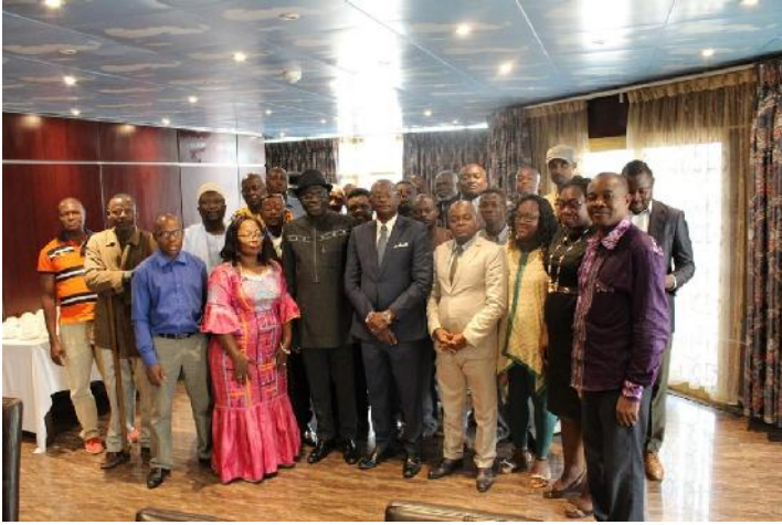
a- Atelier de validation de l'annuaire des PME/PMI et opérateurs artisanaux