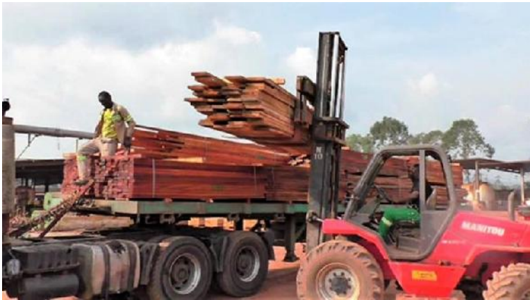
h- Chargement du bois légal acheté par une PME sur le site d'une entreprise forestière